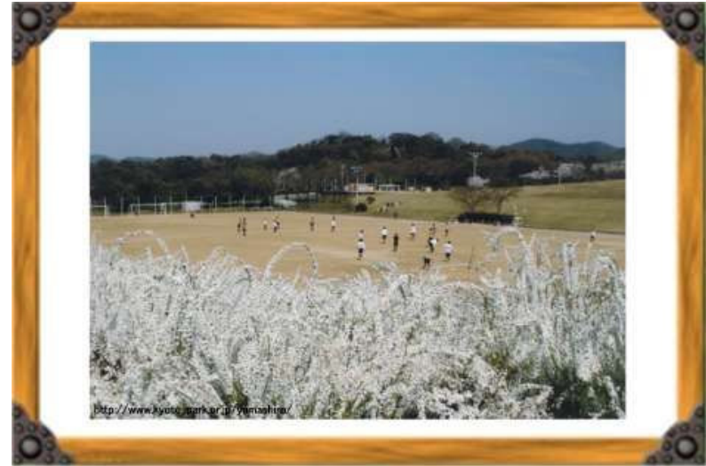
雪桜とサッカー試合風景