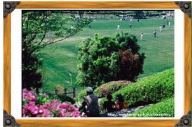
競技場の傍らに憩う