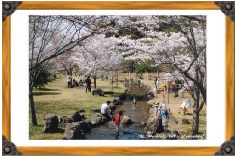
桜の下 川で遊ぶ子供たち